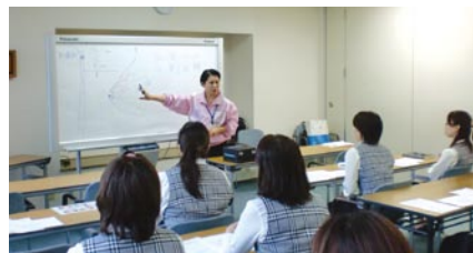
本社での乳がんセミナー