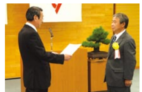
秦野市長から表彰されるベルノックス 続取締役