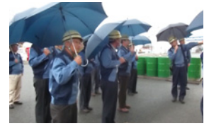
小名浜工場見学会

小名浜工場では、近隣の川区長はじめ「下川を考える会」の方々を迎え工場見学会を行いました。小名浜工場で生産している製品が、生活に欠かせない分野やIT関連の最先端の分野でも使われていることや、環境・保安活動にも積極的に取り組んでいることを紹介しました。