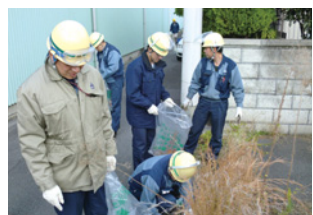
各地の美化・清掃活動の様子